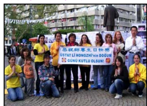
土耳其大法弟子恭祝师尊生日快乐