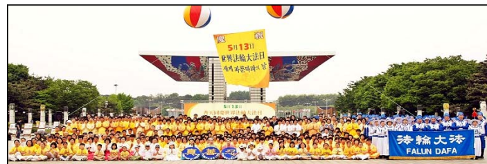
韩国法轮功学员以各种形式庆祝世界法轮大法日，并恭贺师尊生日快乐