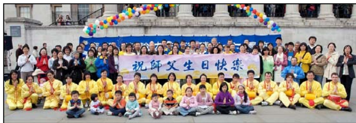
英国大法弟子庆祝第十届世界法轮大法日，并恭祝师尊五十八周岁生日快乐