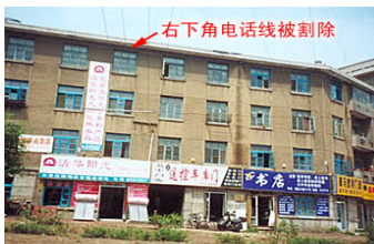
师父在长春的家，位于建设街和解放大路交汇路口西北角，面积 20 多平方米。

有一天从十二期班上下课回家，在北京五棵松地铁站等车，看到老师从后面走来，旁边有他的家人和一位学员，都提着饭盒。地铁来了，人们拥着进车门，我也用力向老师这边挤着。人们挤进车门瞟到哪有位子，一步就蹿过去。等我进来隔着玻璃望见老师他们要进隔壁的一节车厢，只见到老师一点不着急，让别人先进，他几乎是最后进来。这时还有一两个空位，我心里很着急，心想快点就能坐上。可老师静静的，似乎根本就没感觉。人们瞬间就挤着坐定了，就剩他一人站在那里。我的心在翻动，就感到他是那样的不同。开课的方式也不同于我所见过的任何集体讲话的方式。到点就上课，不绕弯，直奔讲课内容。所到之处没见哪个社会名流来捧场，也没有前呼后拥一群人。我默默地想，这位老师一切都是那么真实，没有造作，没有掩饰。渐渐地我心里升起了一个字，就是“正”。老师怎么这么正，正的让人不可思议。（北京学员）