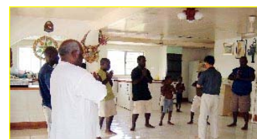
■南太平洋岛国一巴布亚新几内亚前副总理及家人学炼法轮功