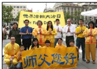
慕尼黑大法弟子向师父问好