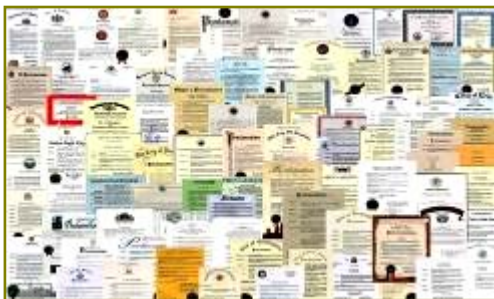
■法轮大法获各国政府褒奖、支持议案信函 2977 项(至 2009 年 3 月)。

在这些现象的背后有没有深层的原因？有心人会发现许多问题，如：手无寸铁的法轮功为什么能抵挡住中共不