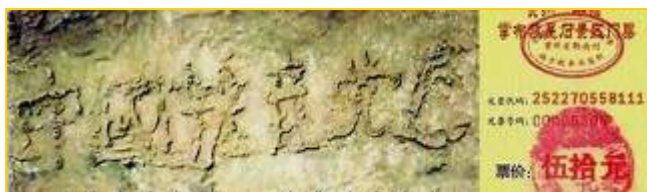
2002年6月在贵州平塘县发现的“藏字石”，断面上天然形成六个大字：中国共产党亡。专家鉴定该巨石有二亿七千万年历史。图为风景区门票。

过后不久的一天，母亲突然来电话，说父亲被大货车撞了，骑的三轮车都撞散架了，人是从车底下被拽出来的。我急忙赶到医院，看见父亲坐在医院楼道的椅子上，正跟医生开玩笑哪。我一看父亲浑身连块皮儿都没破。医院的CT检查结果出来了，一切正常。三退保平安，真是不虚啊！