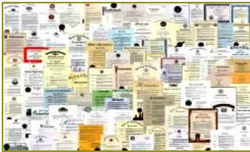
■法轮大法获各国政府褒奖、支持议案信函 2977 项(至 2009 年 3 月)。

在这些现象的背后有没有深层的原因？有心人会发现许多问题，如：手无寸铁的法轮功为什么能抵挡住中共不