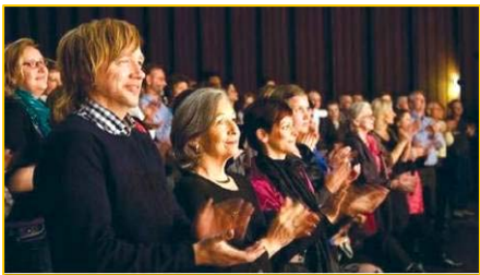
▲ 意犹未尽的挪威观众。▶ 3月25日,台湾的39场神韵演出圆满落幕。民进党主席蔡英文致花篮祝贺。