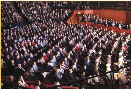
▲ 瑞典斯德哥尔摩 Cirkus 大剧场爆满。▶ 澳洲堪培拉观众为神韵倾倒。