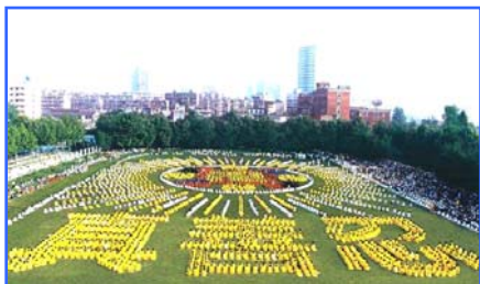
▲5000 多名武汉法轮功学员集体炼功，排组法轮图形和“真善忍”。(1997)

● 法轮大法至今已洪传世界 80 多个国家和地区，获得各国政府褒奖、支持议案、信函超过 2977 项。法轮大法的主要著作《转法轮》已被译成 30 多种文字，在全世界出版发行。