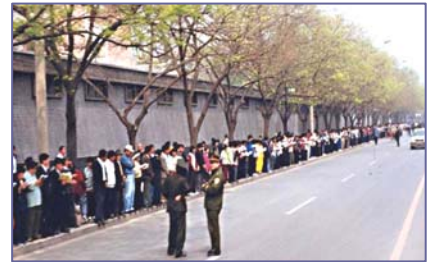
法轮功学员文明安静，警察不用维持秩序，在一旁聊天。