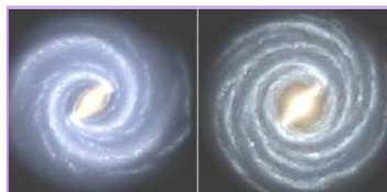
左图：银河系的目前结构 右图：较早的银河系图像 2008 年，天文学家接连发布惊人发现：银河系丢失两个主螺旋臂、太阳正在被银河系抛离诞生地、人类赖以生存的地球似正陷于真空反常时空泡沫中。

在风靡全球的 2009 年神韵艺术团世界巡演中，压轴节目《了解真相是得救的希望》，给各族裔的观众带来深深震撼，韩国梨花女子大学国际关系研究生院院长崔炳日博士说：“中华五千年文明的内涵，都与一个主题紧密相连，就是我们应如何寻找真相，