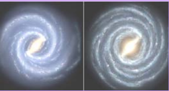
左图：银河系的目前结构 右图：较早的银河系图像 2008 年，天文学家接连发布惊人发现：银河系丢失两个主螺旋臂、太阳正在被银河系抛离诞生地、人类生存的地球似正陷于真空反常时空泡沫中。

中共自建政后，战天斗地、谤佛焚经、压制正信，在 49 年后的和平时期，由于其残酷的政治运动和荒诞的大炼钢铁、大放卫星，导致七千多万中国