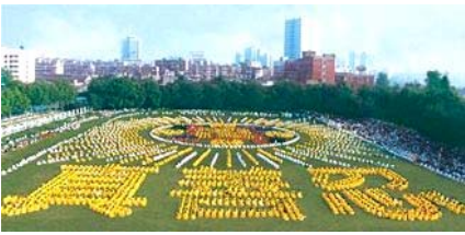
■一九九八年，武汉，五千多名法轮功学员集体炼功。