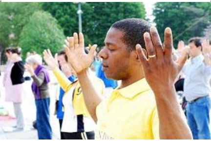
■“真善忍”的巨大威德和感召力超越国界，受到各族裔的珍视。图为今年五月法国法轮功学员在庆祝活动中集体炼功。

“法轮功于国于民有百利而无一害”的结论，并于年底向中共中央政治局提交了调查报告。