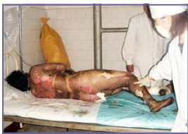
左图：“自焚”者被全身紧包