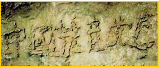
■ 二零零二年六月，贵州省平塘县风景区惊现距今二

真是人逢喜事精神爽。没想到老爸这一退党，竟然退掉了使他犯愁了好几年的老毛病。他退党后没过几天，人就痊愈出院了。到零九年五月，三年过去了，老爸再也没犯过这种稀奇古怪的老毛病。