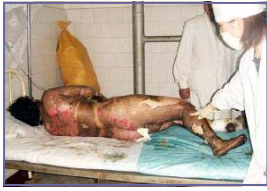
左图：“自焚”者被全身紧包