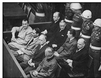
图：纽伦堡审判历史图片

【明慧网】在 60 多年前对德国纳粹罪行进行审判的纽伦堡审判，是人类有史以来最大规模的审判。审判一开始，所有纳粹战犯用同一个理由为自己辩护：“执行法律的人不受法律追究，杀害犹太人是在执行法