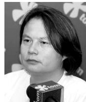
2008年12月23日，原中央电视台东方时空制片人陈虻47岁突然死于胃癌

2008年12月23日，平安夜的前一天，中央电视台新闻评论部副主任、正值壮年的陈虻，在发现胃癌九个月后痛苦死在北京肿瘤医院，死时47岁。