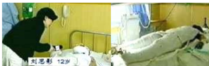
气管切开还能说唱？记者 央视《焦点访谈》中的“自焚者”被包裹得严密。采访不穿防护服不戴口罩。