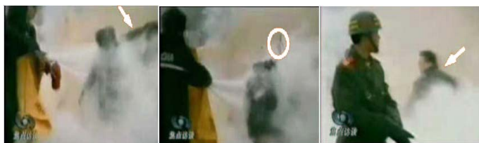
1.刘头部受重击 2.击打后飞出 3.打击者仍保持用力姿势