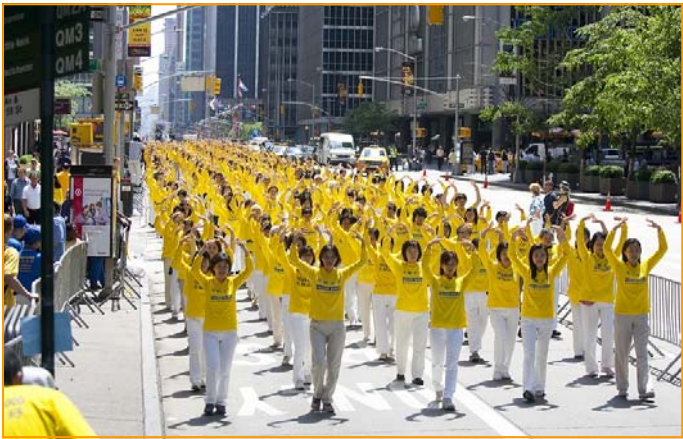
上图：几百人的炼功队伍随着炼功音乐，展示着法轮功“缓、慢、圆”的功法，众人为之惊叹。