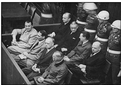
图：纽伦堡审判历史图片

在 60 多年前对德国纳粹罪行进行审判的纽伦堡审判，是人类有史以来最大规模的审判。审判一开始，所有纳粹战