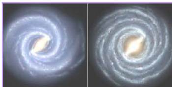
左图：银河系的目前结构 右图：较早的银河系图像 2008 年，天文学家接连发布惊人发现：银河系丢失两个主螺旋臂、太阳正在被银河系抛离诞生地。根据玛雅预言，我们现在处于整个宇宙和地球新陈代谢的更新期。

“贫者一万留一千，富者一万留二三。贫富若不回心转，看看死期在眼前。”《圣经启示录》则明确告诉我们：当举起右拳向邪恶的兽发誓，（只有中共要求人们加入时举起右拳发誓）就会被打上兽印。不能抹去兽印的人，包括其它国家对中共迫害善良视而不见的人都会遭到上天的惩罚。