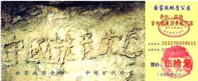
图为藏字石风景区门票：“中国共产党亡”清晰可见

2002 年被发现的、位于贵州省平塘县掌布风景区内“藏字石”，被中科院地质专家鉴定为有 2 亿 7 千万年的历史，五百年前从崖壁落下一分为二，石头断面上清晰可见的六个字是：中国共产党亡(见下图风景区门票)。而央视和国内媒体报道时都隐去了最后一个字。