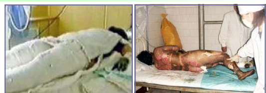
左图：“自焚”者被全身紧包