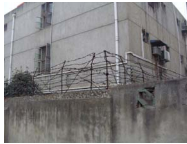
图：武昌区杨园洗脑班

好，真善忍好，一个门警问我喊什么？我面带祥和的说：喊法轮大法好，真善忍好，并告诉他记住法轮大法好，真善忍好，危难来时可以保平安。我的真心诚意打动了这位门警，他没有对我吼叫，只是劝我回房休息吧。