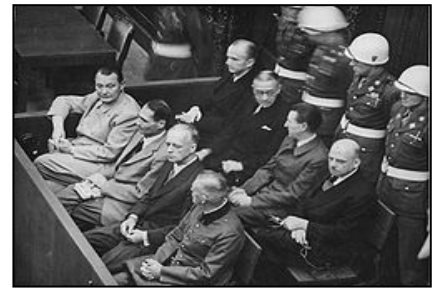
图：纽伦堡审判历史图片