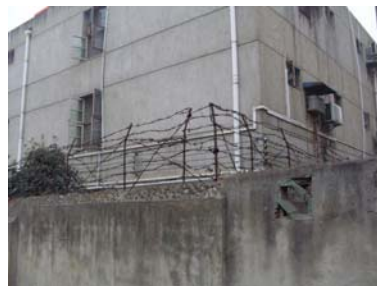
图：武昌区杨园洗脑班

好，真善忍好，一个门警问我喊什么？我面带祥和的说：喊法轮大法好，真善忍好，并告诉他记住法轮大法好，真善忍好，危难来时可以保平安。我的真心诚意打动了这位门警，他没有对我吼叫，只是劝我回房休息吧。