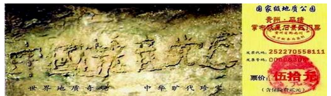
图为藏字石风景区门票：“中国共产党亡”清晰可见

三月，应平塘县委、县政府的邀请，以全国政协委员、中国科学院地学部副主任、中国科学院院士、著名地质学家李廷栋，中国科学院院士，著名地质专家刘宝君，中国地质大学教授、国土资源部国家地质公园评委、著名古生物学专家李凤麟等15人组成的“贵州平塘地质奇观--中国名家科学文化考察团”，于2003年12月5日至8日深入掌布河谷重点对“藏字石”进行实地考察。专家一致认