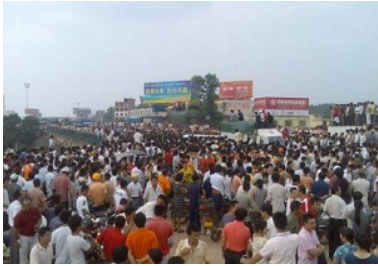
六月十五日，江西南康上万民众抗议政府的苛捐杂税

说白了，中共最大的恐惧来自对真相的恐惧，它害怕自己对中国民众欠下的血债曝光，害怕人民对它的清算，害怕失去权力。中国普通民众已经对中共的暴力和谎言开始了维权反抗，从杨佳、郑玉娇的个体以暴抗暴，到江西省赣州南康市上万民众抗议等不断涌现的民众大规