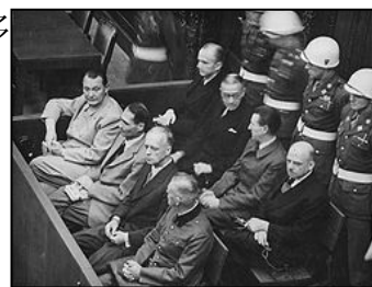
图：纽伦堡审判历史图片

【明慧网】在60多年前对德国纳粹罪行进行审判的纽伦堡审判，是人类有史以来最大规模的审判一开始，所审判。有纳粹战犯用同一个理由为自己辩护：“