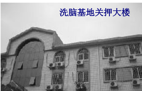
洗脑基地关押大楼

虽然是被强制关在这里，但也不是白住、白吃的。有人说，这里的费用比宾馆没得少。该中心开办初期，每个法轮功学员每月须交纳7千元以上的洗脑费。如今，收费“下调”，但住宿加上伙食费仍需120元/天，陪护费50元—60元/天。费用由法轮功学员自己负担。