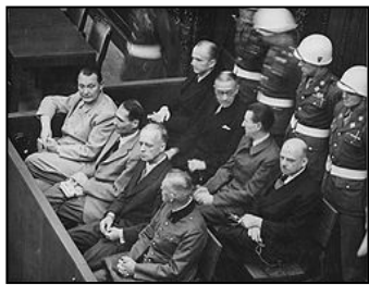
图：纽伦堡审判历史图片

审判的纽伦堡审判，是人类有史以来最大规模的审判。审判一开始，所有纳粹战犯用同一个理由为自己辩护：“执行法律的人不受法律追究，杀害犹太人是执行法律。”希特勒通过法治实施专制和运用法律灭绝种族。对待犹太人，第一步通过立法进行身份上的区分，使犹太人与其他人区别开来；第二步通过立法禁止犹太人经商，切断了犹太人的财富来源；第三步通过强制劳役法，使有劳动能力的犹太人从事超强度的劳役，在将他们的体力耗尽后再赶往集中营从肉体上消灭。600万犹太人就是这样分步骤被屠杀的。因此所有纳粹战犯都有理由说：杀人是在执行法律。