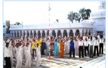
■ 在印度班加罗尔炼功 (2009.5)