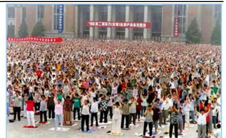
■ 沈阳万名法轮功学员集体炼功 (1998 年)。

在古老的佛国印度，大城市都有炼功点，仅班加罗尔就有八十多所学校师生修炼法轮功，学生在体育课集体炼功，法轮大法主要著作《转法轮》中的《论语》被纳入学校英文教材的卷首。