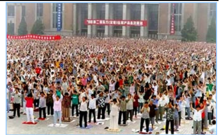
■ 沈阳万名法轮功学员集体炼功 (1998 年)。

在古老的佛国印度，大城市都有炼功点，仅班加罗尔就有八十多所学校师生修炼法轮功，学生在体育课集体炼功，法轮大法主要著作《转法轮》中的《论语》被纳入学校英文教材的卷首。