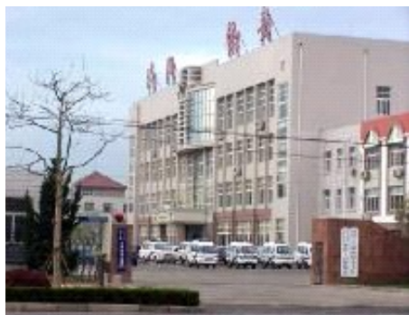
← 参与迫害 法轮功学 员的城阳 区正阳路 派出所 电话: 87868039

张玉珍老人的残疾女儿江静,因坚持修炼法轮功,一直受到当地恶党人员、恶警的迫害,被迫流离失所在外至今达十年之久。