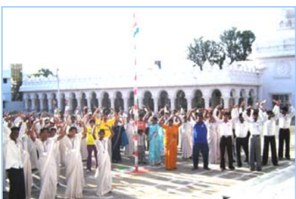
■ 在印度班加罗尔炼功 (2009.5)