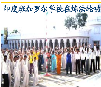
印度班加罗尔学校在炼法轮功

轮功人数最多的地区，目前有超过八十所学校的师生炼法轮功，有些学校甚至超过三千名学生，他们在体育课上集体炼法轮功。学生和师长们普遍身心获得改善。神奇的是昔日的调皮学生变得听话且上课专心，功课普遍进步。Byreshawara 学校的校长表示，该校的英文教材中加入了《转法轮》的《论语》英文版，放在教材的最前面。《论语》列入教材，这是印度首创。该校学生人数共二千多人，很多老师每天都读大法书、炼功，弘扬法轮功。◇