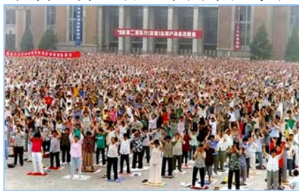
■ 沈阳万名法轮功学员集体炼功 (1998 年)。

在古老的佛国印度，大城市都有炼功点，仅班加罗尔就有八十多所学校师生修炼法轮功，学生在体育课集体炼功，法轮大法主要著作《转法轮》中的《论语》被纳入学校英文教材的卷首。