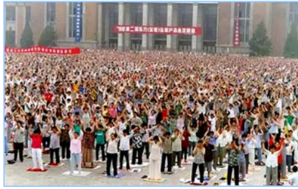
■ 沈阳万名法轮功学员集体炼功 (1998 年)。

在古老的佛国印度，大城市都有炼功点，仅班加罗尔就有八十多所学校师生修炼法轮功，学生在体育课集体炼功，法轮大法主要著作《转法轮》中的《论语》被纳入学校英文教材的卷首。