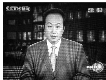
2009 年 6 月 5 日原央视主持人、新闻编辑部副科长罗京 48 岁死于淋巴

罗京生前曾在喉舌媒体上说：“你手上掌握的毕竟是更有扩散性的武器，更有冲击力的武器。一个医生失误了，可能是某一个人的问题，而一个记者，一个播音员、主持人，我在上面这一句话，带来的后果连我自己都不敢设想。”