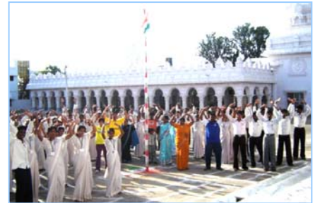
■ 在印度班加罗尔炼功 (2009.5)