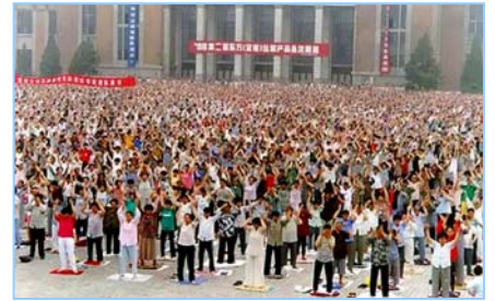
■ 沈阳万名法轮功学员集体炼功 (1998年)。

在古老的佛国印度，大城市都有炼功点，仅班加罗尔就有八十多所学校师生修炼法轮功，学生在体育课集体炼功，法轮大法主要著作《转法轮》中的《论语》被纳入学校英文教材的卷首。