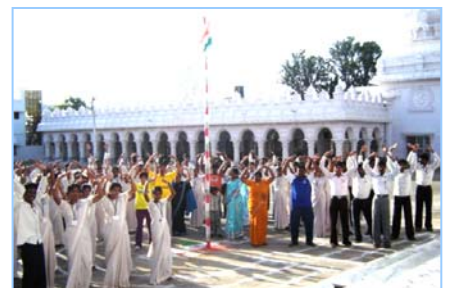
■ 在印度班加罗尔炼功 (2009.5)