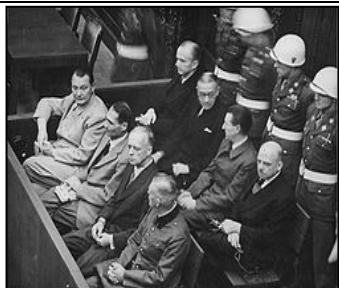
图：纽伦堡审判历史图片

专制和运用法律灭绝种族。对待犹太人，第一步通过立法进行身份上的区分，使犹太人与其他人区别开来；第二步通过立法禁止犹太人经商，切断了犹太人的财富来源；第三步通过强