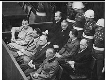
图：纽伦堡审判历史图片

审判。审判一开始，所有纳粹战犯用同一个理由为自己辩护：“执行法律的人不受法律追究，杀害犹太人是执行法律。”希特勒通过法治实施专制和运用法律灭绝种族。对待犹太人，第