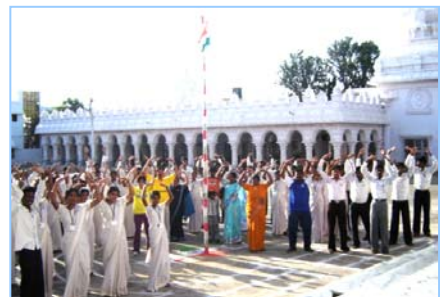
■ 在印度班加罗尔炼功 (2009.5)