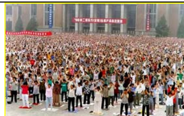
■ 九八年沈阳万名法轮功学员在工业展览馆炼功