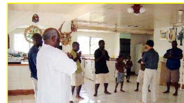
■ 南太平洋岛国—巴布亚新几内亚前副总理及家人学法轮功