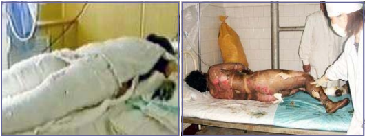
左图：“自焚”者被全身紧包 右图：真正的烧伤病患

用药布包裹烧伤部位，但电视上的“自焚”者却全身包裹严密，丝毫不符合基本的医学常识。