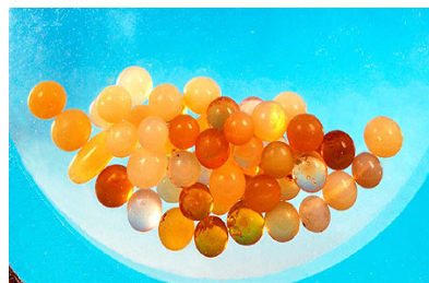
释迦牟尼佛七彩舍利 Shakyamuni Buddha Seven Colour Head Shrine

有关释迦牟尼的一些事情，历史流传下来的很多佛经中都有记载。释迦牟尼是古印度迦毗罗卫国（今尼泊尔境内）的太子。19 岁时，他有感于人世生、老、病、死等诸多苦恼，舍弃