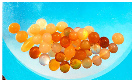
释迦牟尼佛七彩头舍利 Shakyamuni Buddha Seven Colour Head Shrine

有关释迦牟尼的一些事情, 历史流传下来的很多佛经中都有记载。释迦牟尼是古印度迦毗罗卫国(今尼泊尔境内)的太子。19 岁时, 他有感于人世生、老、病、死等诸多苦恼, 舍弃王族生活, 出家修行。35 岁在菩提树