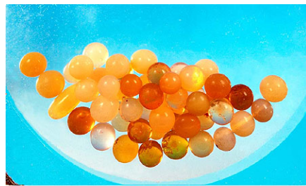
释迦牟尼佛七彩圆舍利 Shakyamuni Buddha Seven Colour Head Shrine

有关释迦牟尼的一些事情，历史流传下来的很多佛经中都有记载。释迦牟尼是古印度迦毗罗卫国（今尼泊尔境内）的太子。19 岁时，他有感于人世生、老、病、死等诸多苦恼，舍弃王族生活，出家修行。35 岁在菩提树