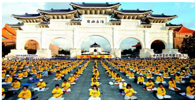
二零零八年十一月四日，三千多名台湾法轮功学员在台北自由广场前炼功，抗议中共迫害法轮功。

其次，我国宪法规定：公民有政治权利、经济权利，信仰自由的权利。因此在我国，公民即使搞政治也是合法的，应该受到法律保护，谁剥夺也是违法的。搞政治并不是中共的专权！但即使这样法轮功也不搞政治， 法轮功就是佛法修炼，不与任何