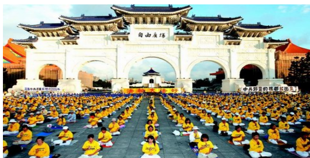
二零零八年十一月四日，三千多名台湾法轮功学员在台北自由广场前炼功，抗议中共迫害法轮功。

其次，我国宪法规定：公民有政治权利、经济权利，信仰自由的权利。因此在我国，公民即使搞政治也是合法的，应该受到法律保护，谁剥夺也是违法的。搞政治并不是中共的专权！但即使这样法轮功也不搞政治， 法轮功就是佛法修炼，不与任何