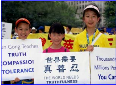
(图为参加美国华盛顿大游行的法轮功小弟子)

曾经以为，选择是痛苦的，因为面对未知的世界，看不到未来。然而今天这个选择，是最简单的，因为一句“真善忍好”，这样的选择不仅能让我们把握现在，也能让我们看到未来。