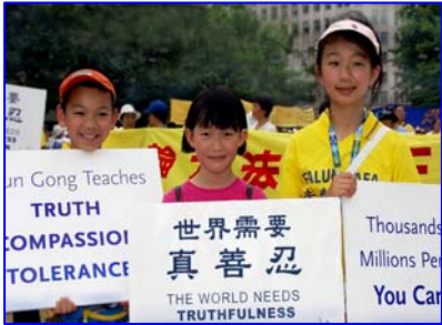
(图为参加美国华盛顿大游行的法轮功小弟子)

曾经以为，选择是痛苦的，因为面对未知的世界，看不到未来。然而今天这个选择，是最简单的，因为一句“真善忍好”，这样的选择不仅能让我们把握现在，也能让我们看到未来。