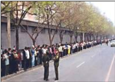
“4·25”和平上访——法轮功学员文明安静，学员背后不是中南海红墙，中共造谣的所谓“围攻中南海”根本不存在。有人认为：1999 年“4·25”和平上访是导致中共迫害法轮功的原因。其实不然。中共从 1996 年起就有预谋的系统实施对法轮功的打压了。三年中，打压不断升级。最后警察殴打及非法抓捕法轮功学员的“天津事件”，引发了“4·25”法轮功学员万人和平上访。

从 1999 年 7 月 20 日中共对法轮功的全面迫害一开始，法轮功学员就不断地给中共领导人写信澄清事实，去有关部门上访述说自己如何得法受益，到天安门展示“法轮大法好”的横幅，后来，进一步揭露并要求惩治恶首江泽民及其帮凶罗干、刘京、周永康，制作并散发揭露谎言和酷刑迫害的有关资料，电视插播真相，海外学员到世界各地的中共使领馆以及联合国和平请愿，等等各种各样的举措，希望中共了解真相，能纠正错误，惩治恶首，停止迫害。