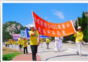
声援退党队伍行进在北竿