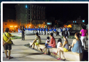
天国乐团在滨海公园演奏

台湾法轮功天国乐团零九年八月一日踏上马祖，给马祖民众带来了希望。军乐队吹遍每个角落，法鼓法号响彻云霄；法轮功学员制作的美丽纸莲花在纯朴的居民手里传开，把真相传遍每家每户。