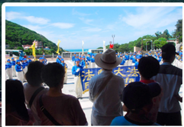
天国乐团在民俗文物馆演奏