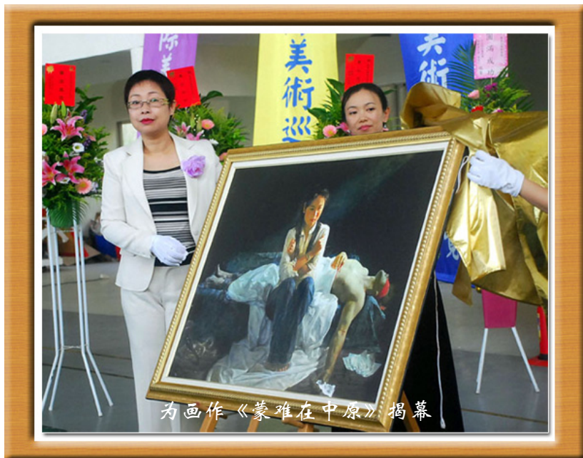
为画作《蒙难在中原》揭幕