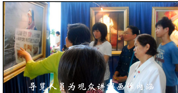
导览人员为观众讲解画作内涵