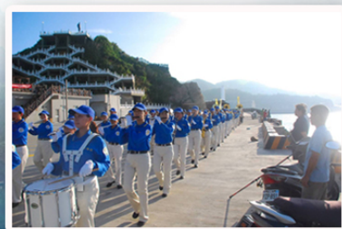
壮阔军乐响彻福澳港