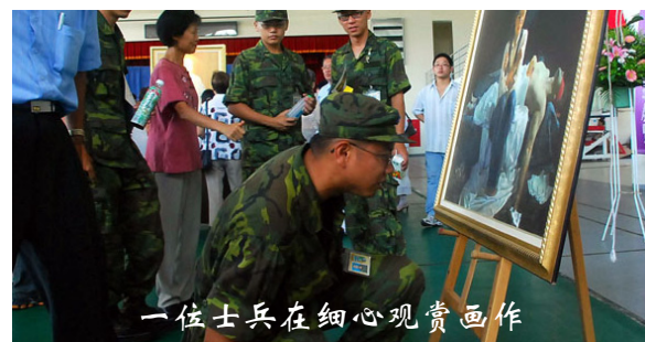
一位士兵在细心观赏画作