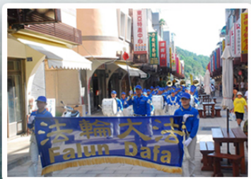
天国乐团巡行南竿马祖港