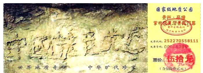
贵州省平塘县掌布乡风景区门票

善恶有报是天理，多行不义必自毙。中共一党专制独裁统治几十年来，为维护它的特权稳定，搞了十几次各种名堂的政治运动，整死、害死了我们骨肉同胞八千多万，比一、二次世界大战死亡人数总和还多。一个人杀人，法律要判死刑，一个党杀害了那么多无辜百姓就完事了吗？常言说得好：人不治天治，老天有眼，谁干了坏事都得偿还。善恶有报是历史的规律，谁也抗拒不了。