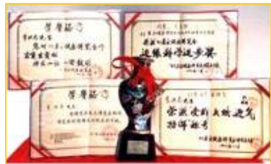
■李洪志老师参加 1993 年东方健康博览会获得奖杯和奖

一九九三年春天，师父来武汉传法，当时是在中央部级科研单位的礼堂举办的学习班。有一件事我终身难忘。当时办班一期是十天，师父每天要用一个半小时以上为大家讲法，然后再教练功动作。在学习班开始后的一天，有一个年约 40 多岁、瘦高个的男子，因没有学习班的听课证非要进去不可，被工作人员拦下，并向他说明要凭听课证才能进去。他不但不听劝阻，反而大吵大闹：我来就是和他（指师父）斗法的，我的师父 100 多岁了，他这么年轻……这男子说了很多不好的话。后来这事