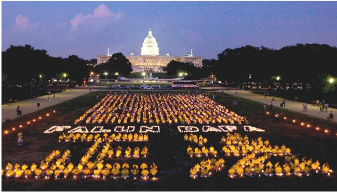
二零零九年七月十六日晚，美国国会山前法轮功学员烛光集会，悼念十年来被中共迫害致死的大陆同修，并组字“正法”和英文“法轮大法”。

【明慧网】二零零九年七月二十日，法轮功学员反迫害十周年之际，在亚、美、欧、澳各国的大集会和游行纷纷举行，呼吁更多人关注对法轮功的迫害，认清中共的邪恶，共同制止迫害。