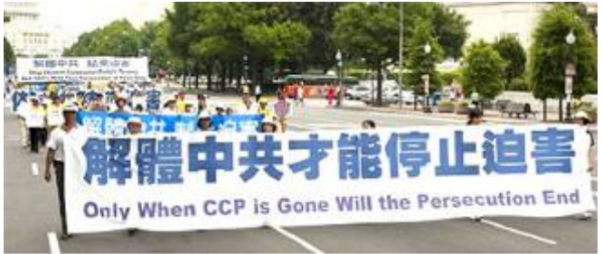
▲ 华盛顿反迫害十周年大游行。 ▼ 2002 年在贵州平塘县掌布乡发现的藏字石，石头断面上天然形成六个字：中国共产党亡，昭示着“天灭中共”的天意。图为风景区门票。

中共把法轮功的善良民众强行推到了中共最大敌人的位置，也就决定了只有解体中共才能停止迫害的结局。◇文／欧阳非