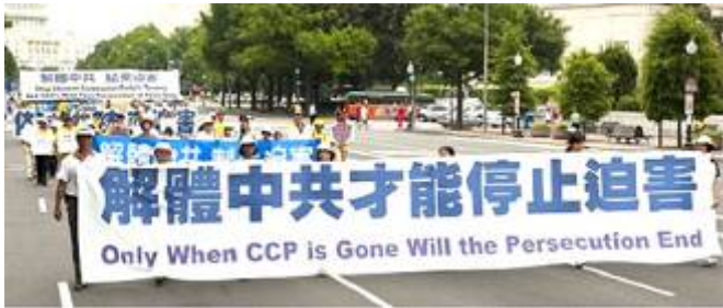
▲ 华盛顿反迫害十周年大游行。 ▼ 2002 年在贵州平塘县掌布乡发现的藏字石，石头断面上天然形成六个字：中国共产党亡，昭示着“天灭中共”的天意。图为风景区门票。

中共把法轮功的善良民众强行推到了中共最大敌人的位置，也就决定了只有解体中共才能停止迫害的结局。◇文／欧阳非