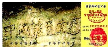
上图为贵州平塘县掌布乡“藏字石”风景区门票

大法祛病健身有奇效，而且使人道德回升，短短几年时间中国就有一亿人修炼，现已洪传世界一百一十四多个国家和地区。中共的恶行，老天都在看着呢！为什么现在很多人都在争着看法轮功真相传单、《九评共产党》，并退出党团队呢？因为加入它就是它的一份子，天灭它时就要跟着遭殃。所以退党可不是什么参与政治，是在顺天意保命啊！在贵州省平塘县掌布乡风景区内，有一块二点七亿年的有字石头——“藏字石”。零二年六月当地人发现，裂开的石头断面有一行汉字，这些汉字经三批国内专家鉴定，其结论为天然形成。而石头上清晰可见的六个字是：中国共产党亡。难道石头也搞政治吗？这不分明是上天警示人吗？