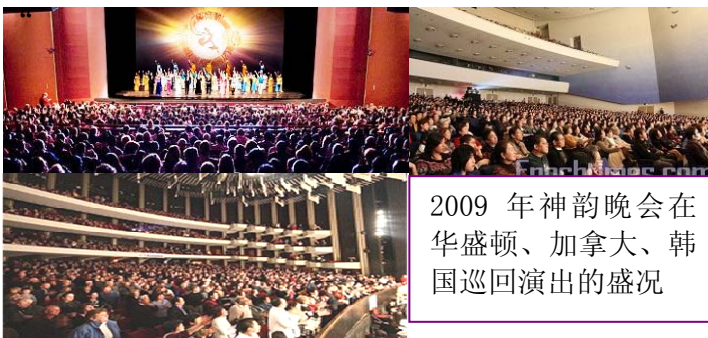
2009 年神韵晚会在华盛顿、加拿大、韩国巡回演出的盛况

神韵晚会简介： 美国神韵艺术团以继承并开创人类的正统文化为主旨，再现中华神传文化之精华。赞美着生命的纯朴，歌颂着信仰的坚定，传播着对神的敬仰和感恩。他们中有世界著名的舞蹈家、歌唱家、演奏家，也有杰出的年轻新秀。