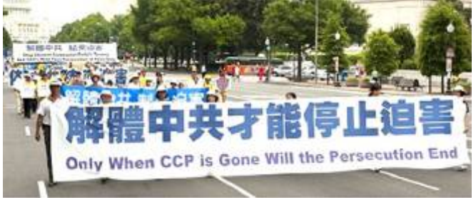
▲ 华盛顿反迫害十周年大游行。 ▼ 2002 年在贵州平塘县掌布乡发现的藏字石，石头断面上天然形成六个字：中国共产党亡，昭示着“天灭中共”的天意。图为风景区门票。

中共把法轮功的善良民众强行推到了中共最大敌人的位置，也就决定了只有解体中共才能停止迫害的结局。◇文／欧阳非