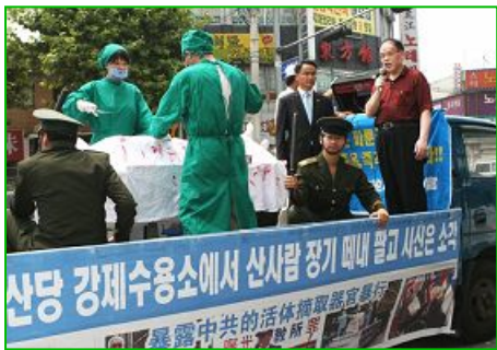
■ 零九年七月十九日，世界各地反迫害大游行中，韩国首都首尔真人模拟中共活摘法轮功学员器官的展示车。

【明慧网】自从中共“活体摘取法轮功学员器官并焚尸灭迹”这一灭绝人性的恶行被曝光之后，法轮大法学会和明慧网于 2006 年 4 月 4 日发起成立“赴中国大陆全面调查法轮功受迫害真相委员会”，并广泛向社会收集调查线索。以下是近日获悉的部份线索。