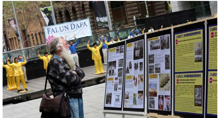
杰克对中共迫害这样祥和的团体感到不可理解