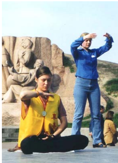
两位乌克兰女士在炼法轮功

法轮功也称法轮大法，或大法，是由李洪志先生于1992年5月传出的佛家上乘修炼大法，以“真善忍”为根本指导。经亿万人的修炼实践证明，法轮大法是大法大道，在把真正修炼的人带到高层次的同时，对稳定社会、提高人们的身体素质和道德水