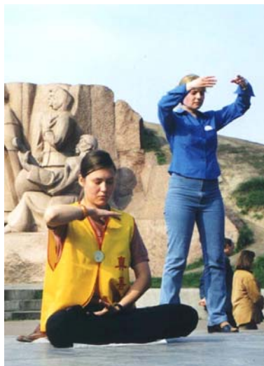
两位乌克兰女士在炼法轮功

法轮功也称法轮大法，或大法，是由李洪志先生于1992年5月传出的佛家上乘修炼大法，以“真善忍”为根本指导。经亿万人的修炼实践证明，法轮大法是大法大道，在把真正修炼的人带到高层次的同时，对稳定社会、提高人们的身体素质和道德水