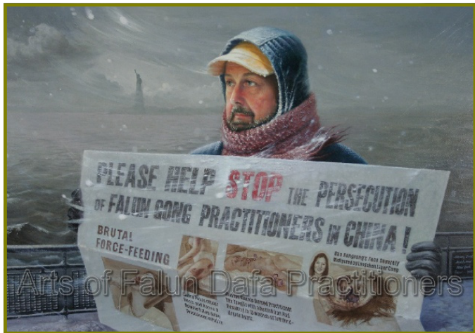
油画《在暴风雪中》，作者：汪卫星，(2005 年)

也许，在他的心中只有简单的两个字“良知”。简单做人也是一种境界，不为名利所累，不为物欲所动，在这种境界中，简单是一种平淡，但不是单调；简单是一种平凡，但不是平庸；简单是一种美，是一种原汁原味的美。（文/萧玉）◇