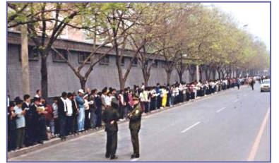
法轮功学员万人 4.25 大上访 文明安静，警察不用维持秩序，在一旁聊天。

但愿外国警察的眼泪能促使中国的警察看清这场迫害的邪恶。这个外国警察说：“制止这样的迫害本来是警察的责任。”那么，中国的警察啊，您在这场对法轮功修炼者的迫害中做了什么？您不应该尽一下自己的责任吗？◇