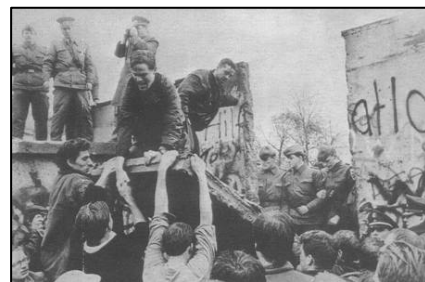
1989 年 11 月柏林墙被拆除的瞬间