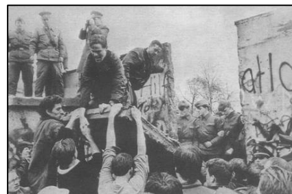
1989 年 11 月柏林墙被拆除的瞬间