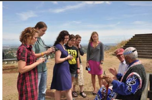
■游客们人手一份法轮功传单与酋长交谈

客。人们一到山顶，就被酋长特有的服饰所吸引，当得知酋长上山为了声援法轮大法，更是充满了兴趣，几乎每个人都拿了一份法轮大法真相传单。很多人和酋长愉快交谈并合影留念；中国大陆的游客们纷纷把报纸和光碟藏进书包，其中三人当即退党。◇