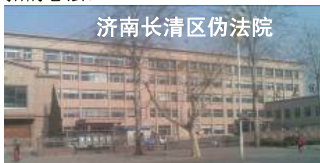
济南长清区伪法院

中共邪党的法律自出现之日起从来都不是为了公平、公正和保护人民的合法权益，尤其是一九九九年法轮功遭到迫害以来，邪党的法律已经沦为了赤裸裸的害人工具，成了不折不扣的恶法。