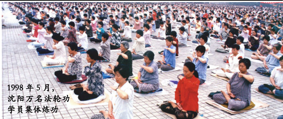
1998年5月， 沈阳万名法轮功 学员集体炼功

我二姐是法轮大法学员，知道后，领我看了医生，把我接到她家。在二姐的引导下我开始了解法轮功，修炼法轮大法。我的病很奇怪，医生也没确诊我得了什么病。好好的皮肤就是痒痒，非抓破不行，血淋淋的疼痛难忍，走路都困难了，吃药也一点