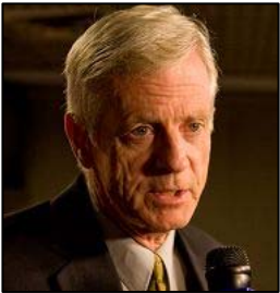
加拿大前亚太司司长大卫·乔高

2000年2月塞内加尔法庭也成功引用“普世司法管辖权原则”，对乍得(Chad)前流亡总统 Hissein Habre (侯赛因)，1982至1990年间参与4万件政治谋杀和20万件的刑求案罪行提起诉讼。乍得国内法律虽未明列该原则，但因乍得签署联合国禁止酷刑和其它残忍、不人道或有辱人格待遇或处罚公约(Convention against Torture)，该公约要求缔约国按“普世司法管辖权原则”，拘捕其境内触犯国际法律嫌犯，侯赛因被关押于乍得狱中。