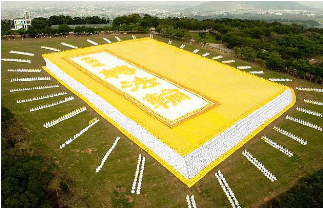
■ 2009 年 11 月 21 日，亚洲法轮大法修炼心得交流会召开前夕，六千多法轮功学员在台湾台中县外埔乡青青草原，排出了金光灿灿的巨型《转法轮》。