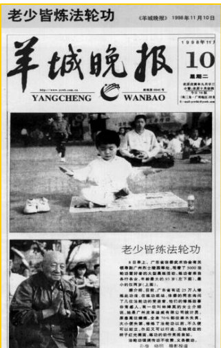
1998 年 11 月 10 日 《羊城晚报》：老少皆炼法轮功