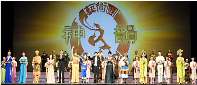
■ 二零零九年十二月十九日晚，神韵演员在奥古斯塔第二场演出后谢幕。