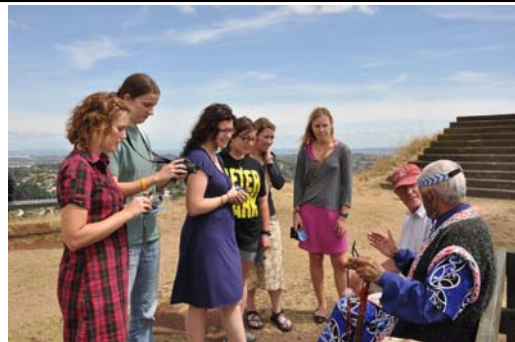
■游客们人手一份法轮功传单与酋长交谈

客。人们一到山顶，就被酋长特有的服饰所吸引，当得知酋长上山为了声援法轮大法，更是充满了兴趣，几乎每个人都拿了一份法轮大法真相传单。很多人和酋长愉快交谈并合影留念；中国大陆的游客们纷纷把报纸和光碟藏进书包，其中三人当即退党。◇